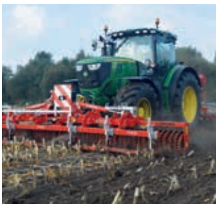
Maisstengelboorderbestrijding en tevens bodembewerking en/of inzaaien