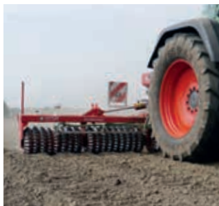
Tussenvrucht zaaien op bewerkte of onbewerkte oppervlakten