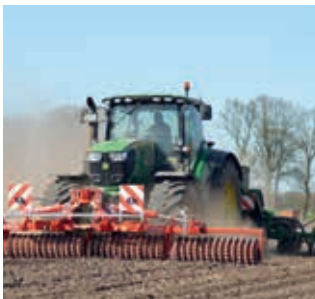
Als frontpakker bij zaaien of poten