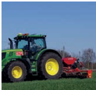
Onderzaaien in bestaande gewassen